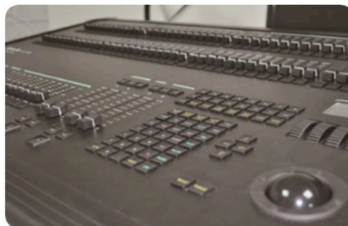
燈光設備系統一覽表